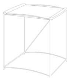
MESA BAJA / LOW TABLE