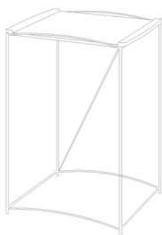
MESA ALTA / HIGH TABLE