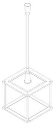
Vitrina individual / Single display