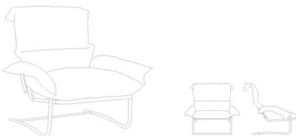
BASCULANTE / TILT CHAIR